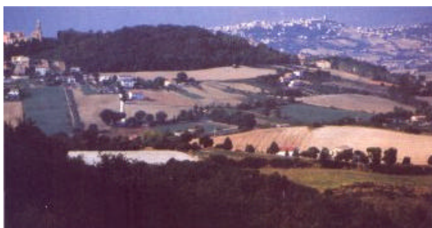
I paesi dell'entroterra marchigiano sono quasi sempre edificati sulla sommità di colline, e nel crepuscolo i panorami, confusi tra i colori chiari dei campi ed il verde rigoglioso della vegetazione, assumono sembianze quasi fiabesche

Le cittadine fortificate, erette sulla sommità dei colli per dominare la campagna circostante ed essere meglio difendibili, raccontano da sole dell'irrequietezza di questi territori, in passato contesi da tutti per la loro ricchezza territoriale, allora unico e vero tesoro da possedere. Olio, vino e cereali costituivano, come oggi il petrolio, la vera merce di scambio e simbolo di "potere". Le colline marchigiane sono ricche di tutto questo, e l'espansione limitata dei centri urbani consente ancora un equilibrio tra ambiente naturale e presenza umana. Armonie e colori che già in passato hanno esaltato la