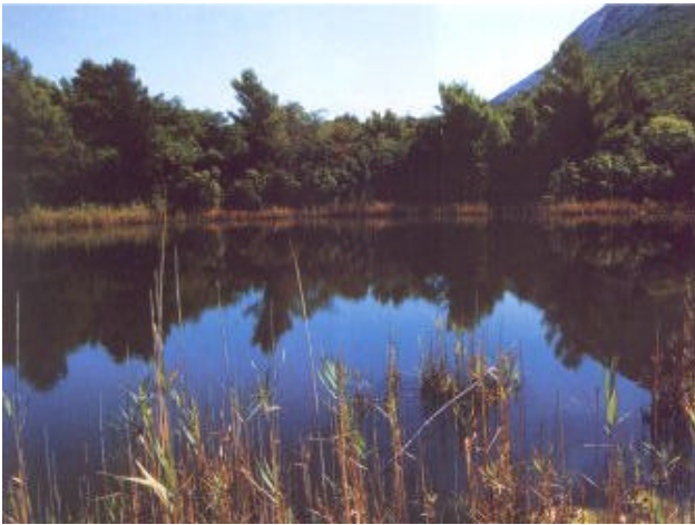
I due laghetti salmastri di Portonovo, protetti come biotopi, sono un piccolo tesoro che nasconde un'incredibile varietà di uccelli, sia migratori che stanziali. Basta "spiare" oltre il fitto canneto per imbattersi nella gallinella d'acqua, in numerose specie di aironi e nel volo frenetico del martin pescatore

Nelle zone più scoscese del monte hanno il loro regno la volpe, il tasso, la lepre, il riccio, la puzzola e molti micropredatori carnivori tra cui donnole e faine. Inoltrandosi nella macchia mediterranea, è facile incontrarli, soprattutto nel tardo autunno, prima della stagione invernale. Sulla costa invece, sul limite tra la vegetazione e le spiagge sassose, si possono ammirare splendidi esemplari di ramarro; per le dimensioni veramente notevoli e la colorazione verde smeraldo, che verso la parte inferiore assume tonalità turchine, con un po' di fantasia possono sembrare delle esotiche iguane!