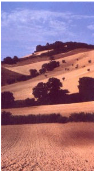
Particolare del paesaggio marchigiano: una miscela di colori e contrasti unica in tutta la penisola, che ha contribuito in ogni epoca ad ispirare alcuni fra i più grandi artisti

Nei flussi migratori di molte specie di uccelli, il Conero rappresenta il punto ideale di sosta tra le pianure del sud, dall'Africa alla Puglia, e il Nord Europa; nei periodi