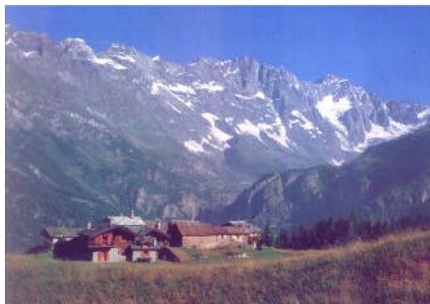
Vista sul Cervino dalla Grande Balconata

Cervino che sta provvedendo a renderla più agevole segnando a nuovo tutto il percorso con il numero 107.