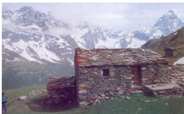
Una caratteristica baita nel secondo tratto di percorso Cheneil-Cervinia