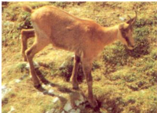
Un esemplare di camoscio d'Abruzzo, osservabile nuovamente dopo la sua reintroduzione

Se nel corso della sua vecchia storia l'uomo del Gran Sasso si è trovato spesso in una posizione di dialettica o di adattamento nei confronti dell'ambiente, la sua storia più recente ha creato un altro forte contrasto. Una storia fatta di aggressioni alla montagna, disboscamenti, costruzione di impianti di risalita, strade e trafori, ed ancora altri recenti progetti di ampliamento e completamento di impianti e skilift.