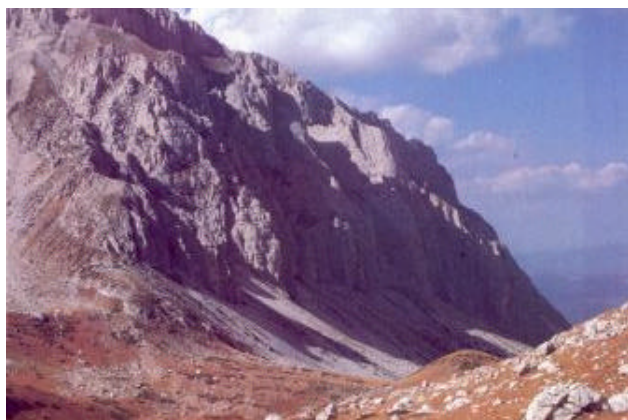
In cammino nella conca di Campo Pericoli

con la prospettiva che assuma anche una funzione didattica ed educativa.