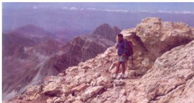
Sulla cima del Corno Grande

Descrizione: dal rifugio Franchetti si raggiunge nuovamente la Sella dei Due Corni. Si continua in direzione est, fra gli sfasciumi dei detriti, lungo l'itinerario n.3, fino alla base delle evidenti rocce, poco al di sotto del Passo del Cannone, dove un sentiero si stacca a sinistra sull'itinerario 3B-3C fino a raggiungere in breve tempo la parte più bassa dell'ormai ridottissimo Ghiacciaio del Calderone, sopravvissuto fino ai nostri giorni dall'era glaciale. Il Calderone è l'unico ghiacciaio dell'Appennino ed è situato in una conca da cui prende il nome fra i 2650 e i 2850 metri, sotto la parete nord-nord est del Corno Grande; si estende per una lunghezza di 400 metri ed una larghezza di 250 metri, con uno spessore medio delle nevi di 15 metri.