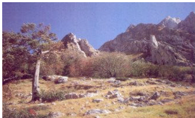
Il Gran Sasso presenta affascinanti contrasti fra gli alberi dei suoi boschi e le rocce circostanti

Tra i due versanti della montagna dovevano esistere chiaramente degli scambi, come dimostrano i numerosi "Vadi", i valichi di antichissime strade di collegamento che testimoniano anche come questa montagna sia stata da sempre un passaggio delle fedi e dei misteri d'Abruzzo.