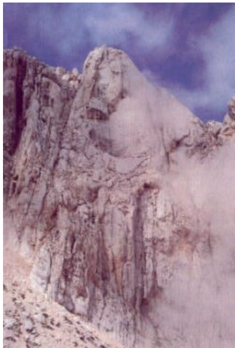
Il Corno Piccolo visto dal Rif. Franchetti

Descrizione: dai Prati di Tivo si segue la strada asfaltata che sale dal piazzale al pianoro di Cima Alta, da dove inizia un sentiero che risale la cresta con un bellissimo panorama sul Paretone est del Corno Grande, fino a giungere all'Arapietra (2000m circa), base anche di arrivo della seggiovia. Da qui si sale su per il sentiero n.3 che conduce al rifugio Franchetti, passando sotto le pareti verticali del Corno Piccolo, a mezza costa nel Vallone delle Cornacchie. Superato il Passo delle Scalette dopo un piccolo tratto attrezzato con una corda metallica, il sentiero continua a salire per lo spuntone che divide in due l'alta Valle delle Cornacchie, dov'è arroccato in bella posizione, tra il Corno Grande e il Corno Piccolo, il rifugio Franchetti, costruito nel 1958 e di proprietà del CAI di Roma.